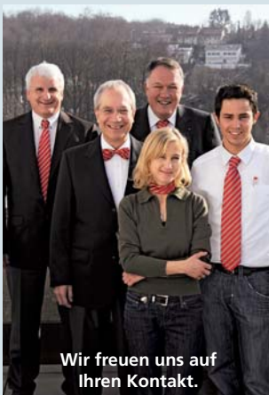
Wir freuen uns auf Ihren Kontakt.